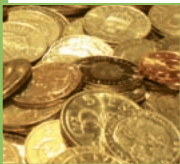
Guadagnare denaro e diventare ricco