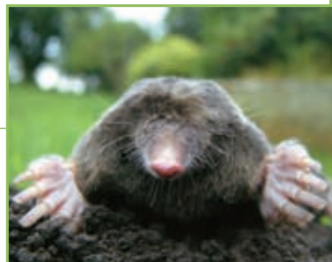
Animale che scava lunghe gallerie sotto terra