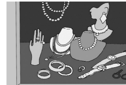
2. In gioielleria ci sono...