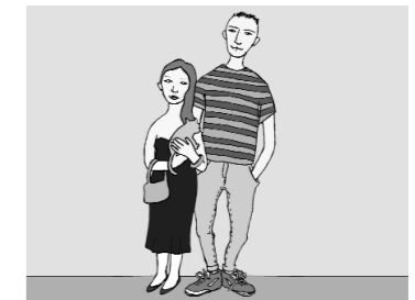
3. Lui è...; lei è...